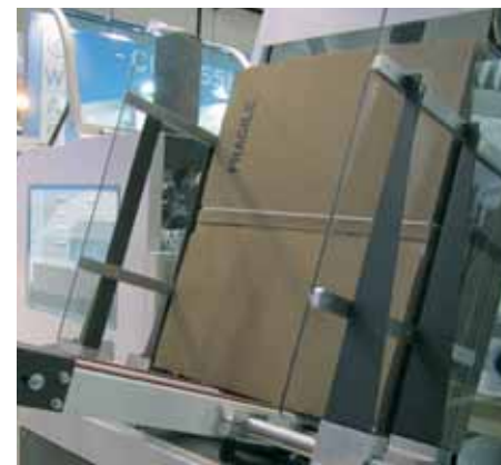
Grupo de formado de caja con almacén de cartones.