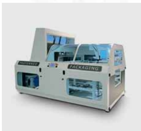
Compacta y versátil.