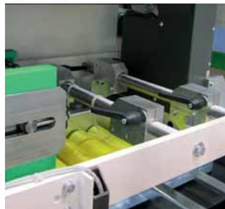
Banda de entrada de diferentes tipos ajustable al producto a agrupar e introducir en caja.