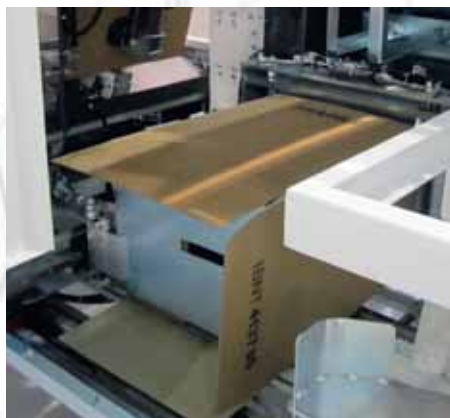
Formado de caja e introducción de producto agrupado en automático.