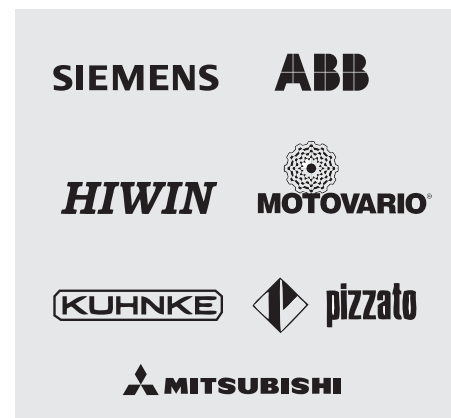
Componentes de alta calidad, certificado ISO para sencilla adquisición en el mercado.