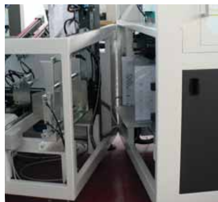
Sistema de carga separada para mayor comodidad para el operario.