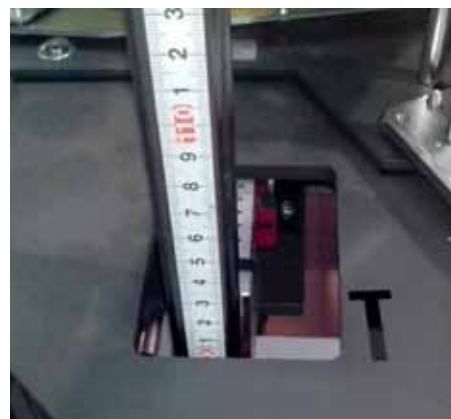
Regulaciones motorizadas para cambio de formato rápido y sencillo. Brazo de ventosas para captura de cartón ajustable.