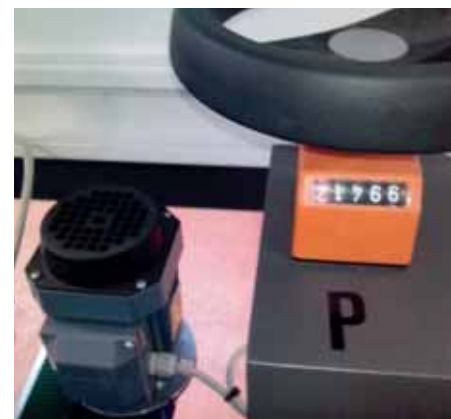
Regulaciones y movimientos sobre guías lineales con ajustes mediante pomos para facilitar los mismos. Precintado de caja montado en la zona de salida de la máquina.