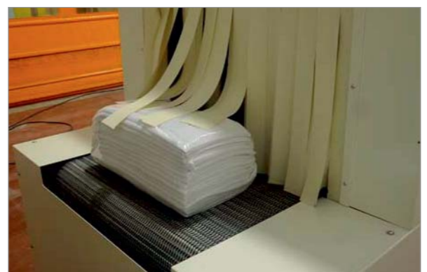
Confezionatrice a risparmio energetico, grazie al nostro tunnel a basso assorbimento che utilizza film poliolefina. Nice shrink wrapping saving energy thanks to our tunnel low absorption and using polyolefine film.