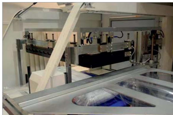
Grande versatilità. Altezza prodotto fino a 400 mm. High flexibility. Product's height up 400 mm.