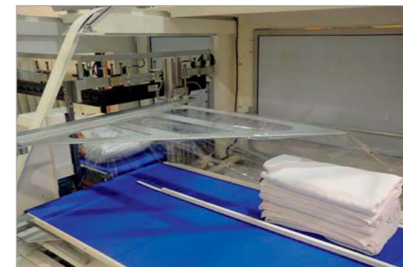
Confezionatrice automatica che chiude completamente il pacco proteggendo il prodotto dallo sporco e risparmiando sul costo del materiale e dell'energia utilizzando poliolefina. Automatic L sealer machine to close completely and shrink saving film and energy using polyolefine film.