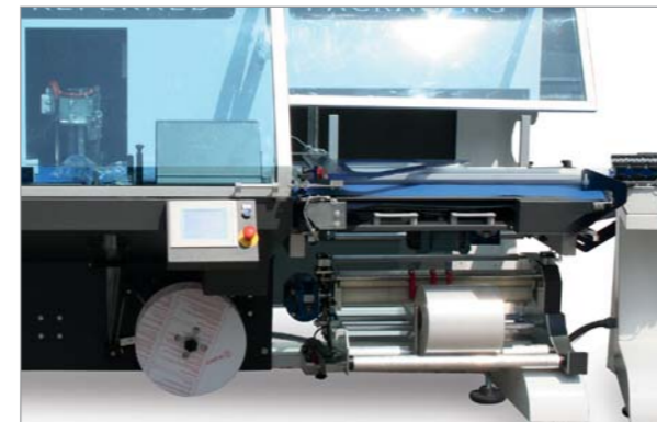
Macchina a sbalzo per facilitarne la pulizia. Cantilever machine for easy cleaning.

Infinite modularity and compositions of the line. Preferred Packaging is specialized in the study of complete plants: loading systems and automatic grouping, for packaging multipack.