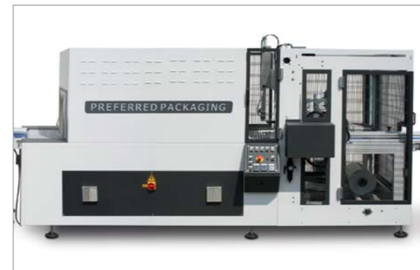
Macchina fardellatrice per confezionamento del multipacco. Poly bundler machine with tunnel for the multipack packaging.