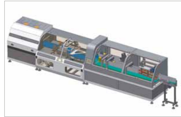
Linea completa Complete line

Preferred Packaging is specialized in studying and projection complete plants for beverage products packaging personalized for each customer's different factory configuration and output need.