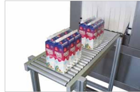
Confezione completamente chiusa, pulita e meno costosa Final pack completely closed, cleaner, no dust inside