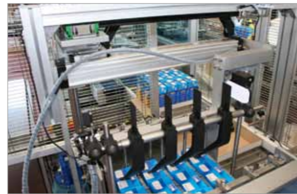
Risparmio energetico Energy saving